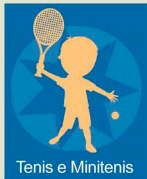
Tenis e Minitenis

Empadroados: 30 €/bimestre No empadroados: 40 €/bimestre