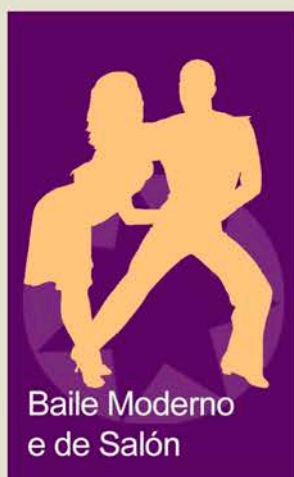
Baile Moderno e de Salón

Empadroados: 30€/bimestre No empadroados: 40 €/bimestre MAX 7 - MIN 5 inscritos por grupo