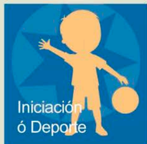
Iniciación ó Deporte

Empadroados: 24 €/bimestre Non Empadroados: 40 €/bimestre