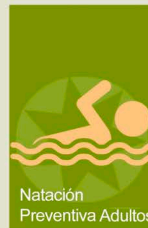
Natación Preventiva Adultos

3 participantes por grupo Empadroados: 40 €/bimestre Non Empadroados: 60 €/bimestre