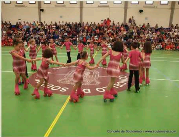
Concello de Soutomaior / www.soutomaior.com