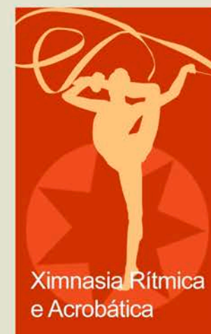
Ximnasia Rítmica e Acrobática

Gratuito, subvenciona Deputación Provincial * Horarios según grupos * Prazas limitadas